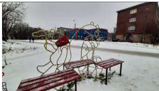
4) Знак «Бесконечная любовь к городу»