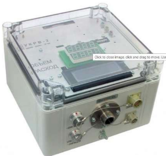
Расходомер воздуха многофункциональный УКРВ-2