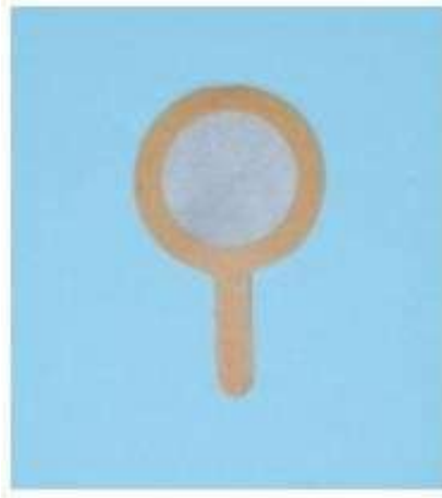
Фильтры сорбционные аналитические АФА-СИ